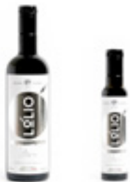
750 ml 250 ml