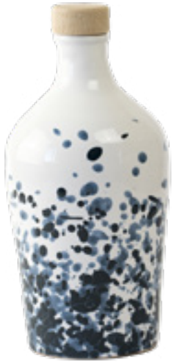
500 ml Collezione Galassia