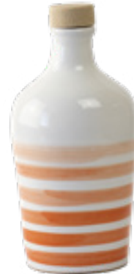
100 ml Collezione Orizzonte