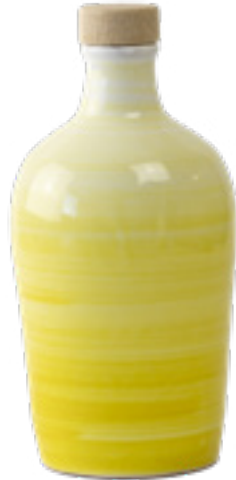
250 ml Collezione Tramonto