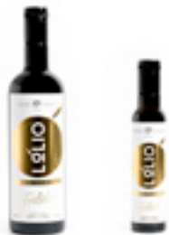
750 ml 250 ml