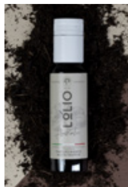
Tartufo Bianco White Truffle