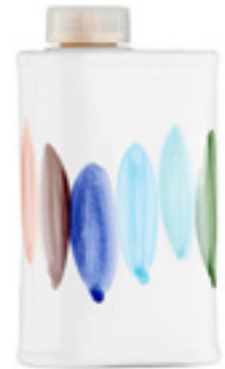
100 ml Collezione Rainbow

Olio extra vergine di oliva, 100% Italiano, ceramica italiana realizzata e decorata a mano da ceramisti pugliesi