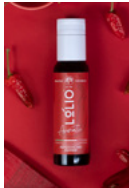
Peperoncino Chili Pepper